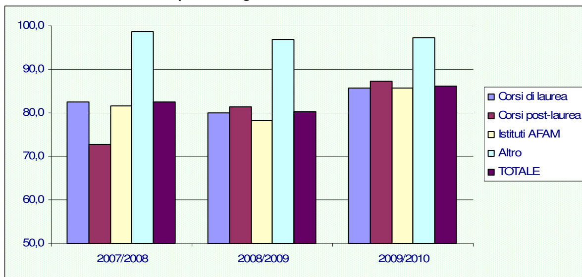
Grafico 1 - Percentuale di copertura degli idonei – a.a. 2007/2008 - 2009/2010

N.B. I dati sono riferiti al 31 ottobre di ciascun anno.